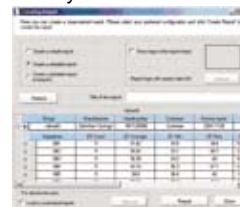
Creating a test report