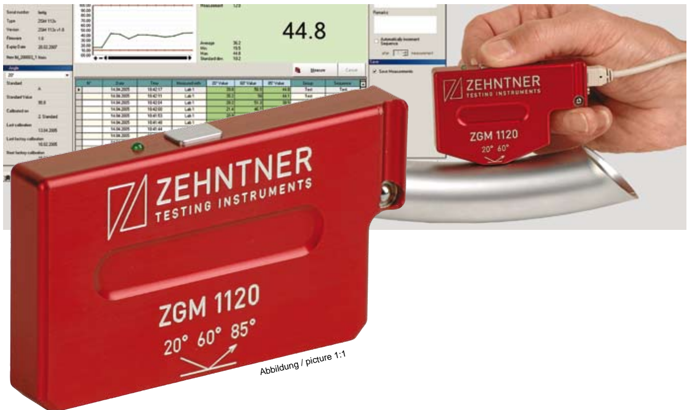
Abbildung / picture 1:1