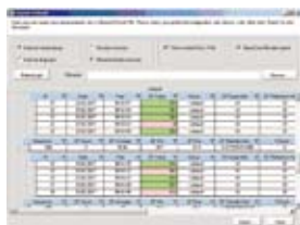
Data export into Microsoft Excel